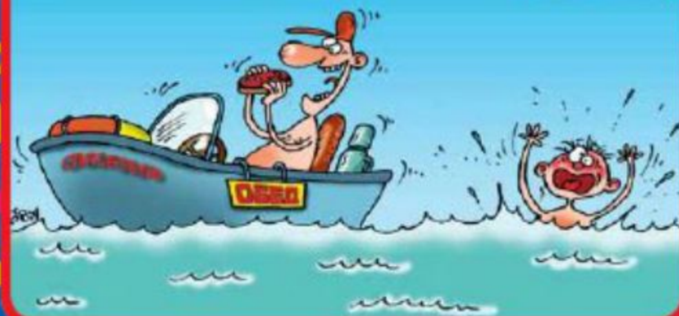
Рисунок В. Бусловских