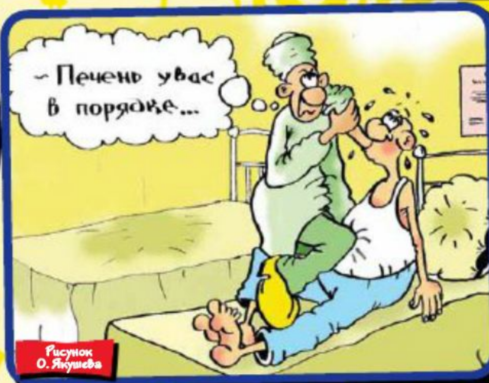
Рисунок О. Юшечева