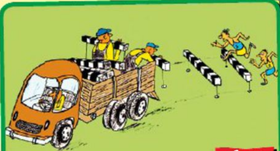
Рисунок В. Солдатова

На всех смотрит свысока. Гордо рассекает толпу массивным бюстом, волооча на поводке мужа, обвешанного детьми, кошками и собаками. На встрече с любовником приводит детей и мужа, оставляя их поиграть в гостиной, пока она «поговорит о деле» в спальне. Для интимных отношений малопригодна из-за привычки регулировать