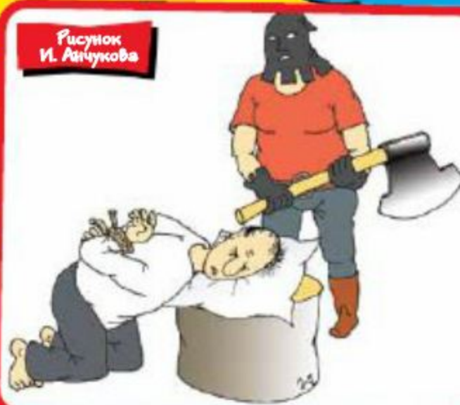
Рисунок И. Анчукова