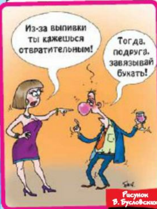
Рисунок В. Бусловских