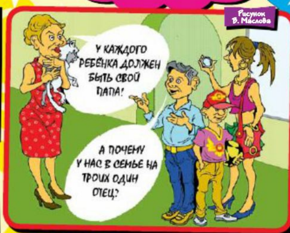
Рисунок В. Маслова

Живу я в Германии. Ездить здесь по российским удостоверениям можно, но не долго, потом надо пересдавать, а так как у немчуры совсем иной стиль езды, наши ездуны со стажем имеют большие проблемы с пересдачей, так как к нему нелегко приспособиться... Не сдал один раз, второй, на третий тебя отправляют на так называемый «идиотен тест», проверяют, все ли у тебя в порядке с головой. Вопросы там самые разнообразные, например: сколько в Германии поворотов (подразумевается, что два: правый и левый), спрашивают, можешь ли поставить три шарика для пинг-понга друг на друга, и если тестируемый пытается это сделать, то он, по их мнению, идиот и есть. И вот приходит наш человек, садится, отвечает на вопросы, все в порядке, экзаменатор елеинным голосом спрашивает, а не слабо ли поставить три шарика друг на друга? Наш человек говорит: — Нет проблем... ДАВАЙ!!! Наш человек вытаскивает изо рта жвачку, склеивает шарики друг с другом и приклеивает к столу... — Битте!