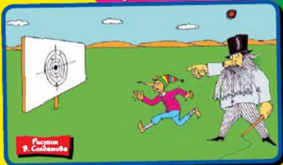
Рисунок В. Солдатов

преступники увезли грузовик с деньгами в лес, где и принялись его вскрывать. Ни разу до сих пор они не занимались ничем подобным, однако знали, что металл режут автогенном. Вооружившись мощными горелками, они начали с разных сторон поджаривать автомобиль. Эффект превзошел ожидания. Машина загорелась, попытки остановить пожар ни к чему не привели. Сами преступники бежали. Двое из них сильно обгорели, пытаясь вытащить деньги из бронебика, и вся шестерка дружно отправилась в ближайшую больницу за медицинской помощью. Здесь их и арестовали полицейские, прибывшие по звонку бдительных медиков. Операция «Ограбление века» бесславно провалилась, однако шестеро молодых мужчин вошли-таки в историю — как люди, устроившие самый дорогой костер XX века: в огне сгорел один миллион фунтов стерлингов.