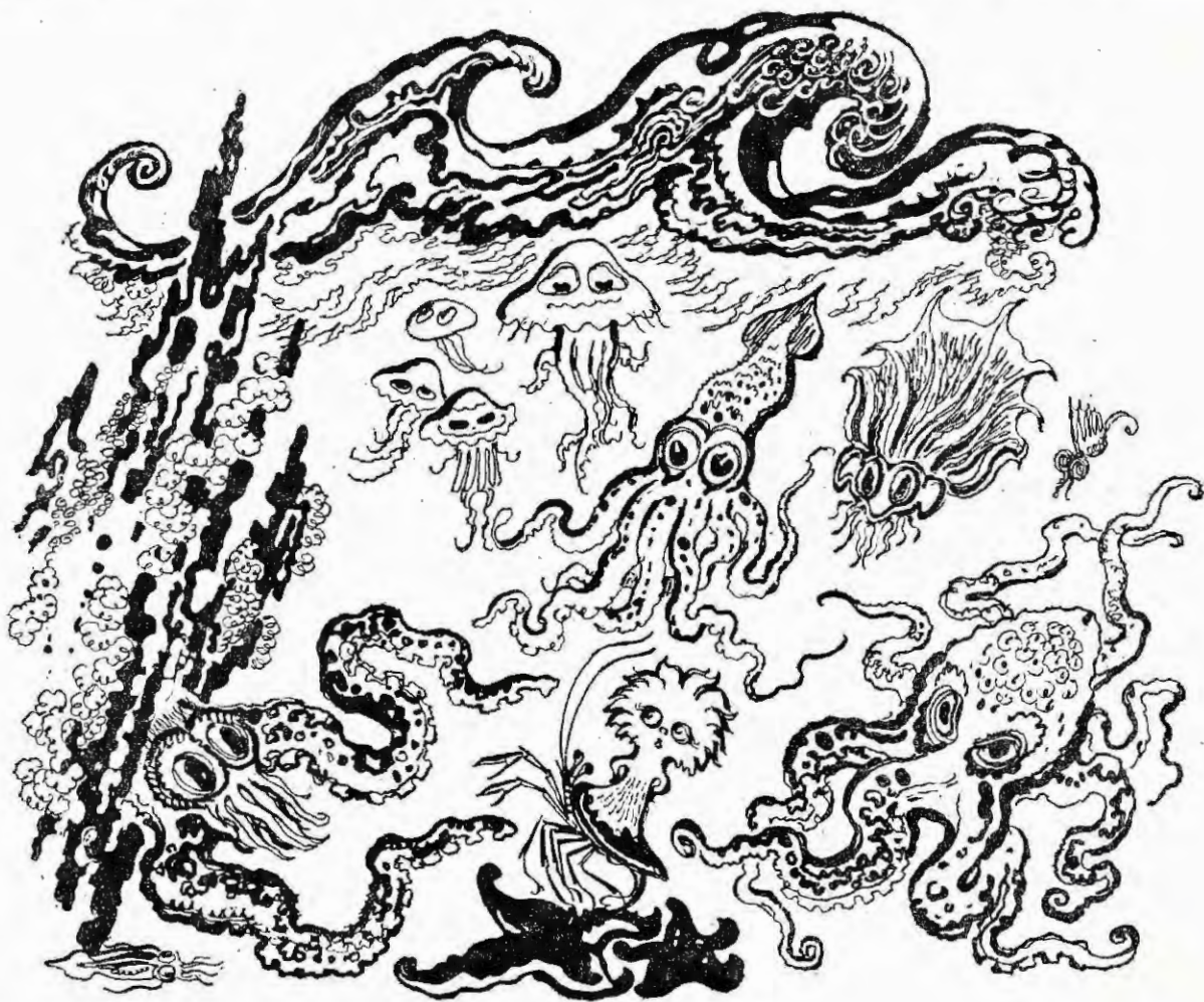
Беззвучно из пещеры выплыла госпожа К.

Он остановился, потому что перед ними было ужасное зрелище! Впереди было ущелье между подводными скалами, и у входа в это ущелье лежала целая гора панцирей Раков, Крабов, и все они были пустые и расколотые