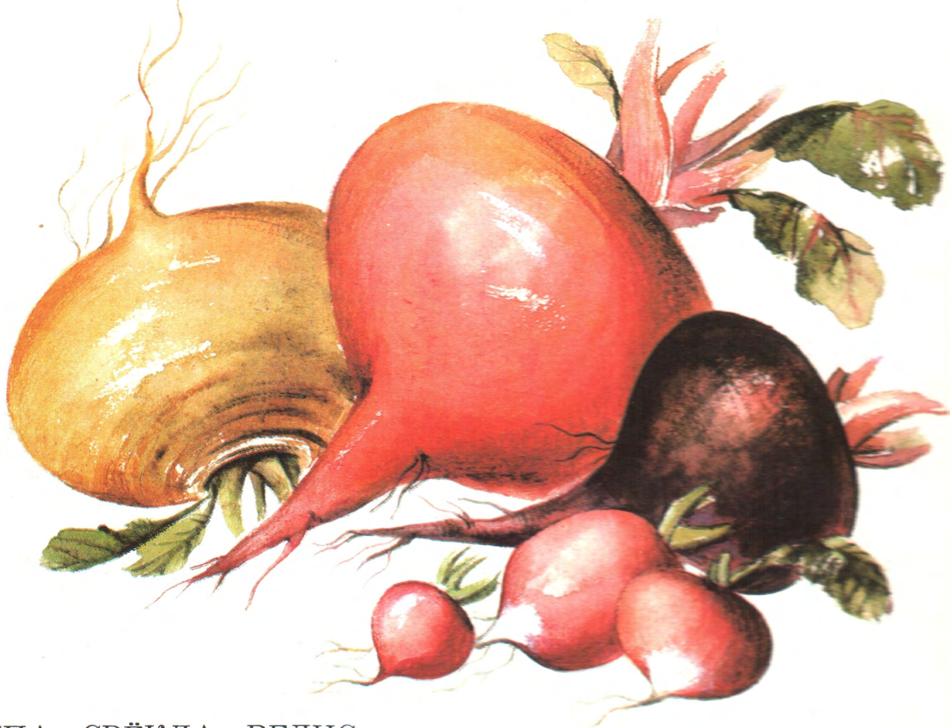
РЕПА, СВЁКЛА, РЕДИС