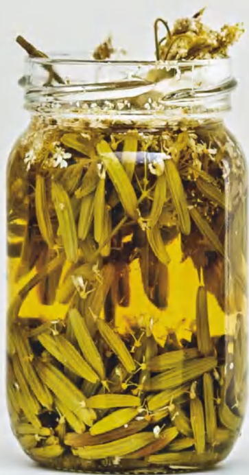
Маринованные семена испанского кервеля, см. с. 64