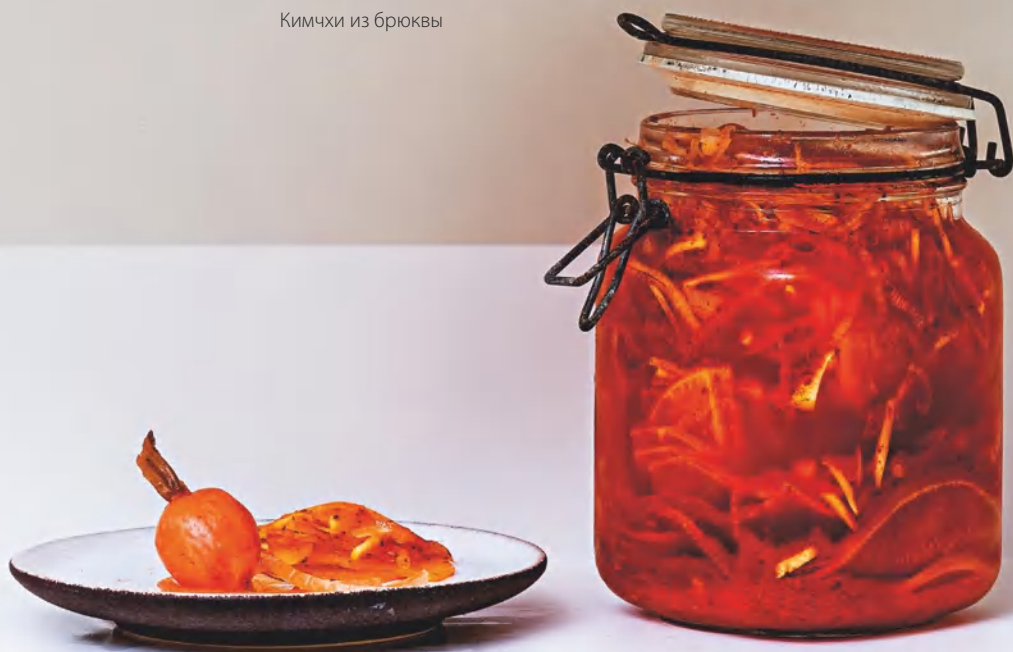
Кимчи из редиса, см. с. 107