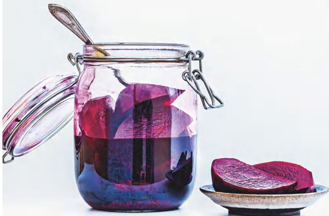
Ферментированная свекла с анисом, см. с. 106