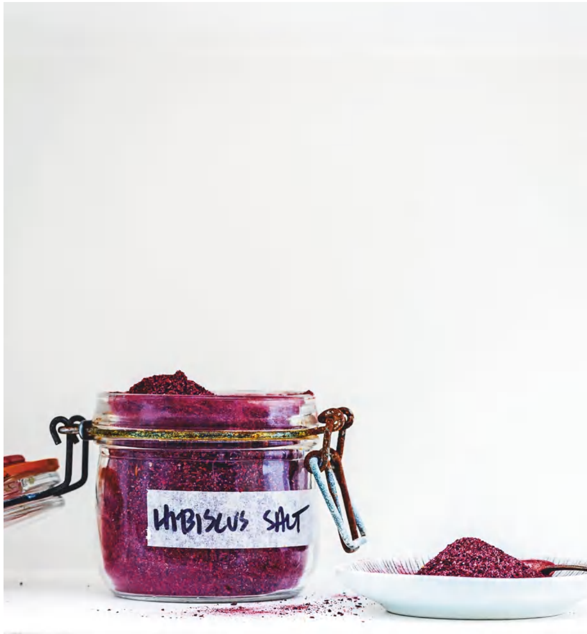
Соль с гибискусом