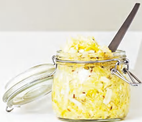
Квашеная белокочанная капуста с тмином