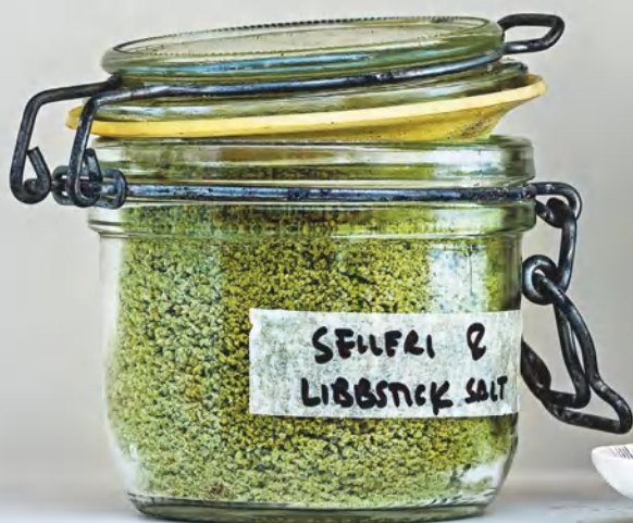
Соль с сельдереем и любистком