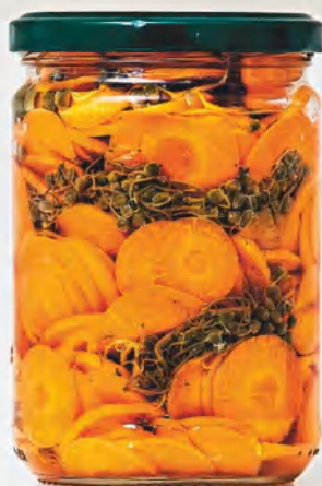
Маринованная морковь с бузиной