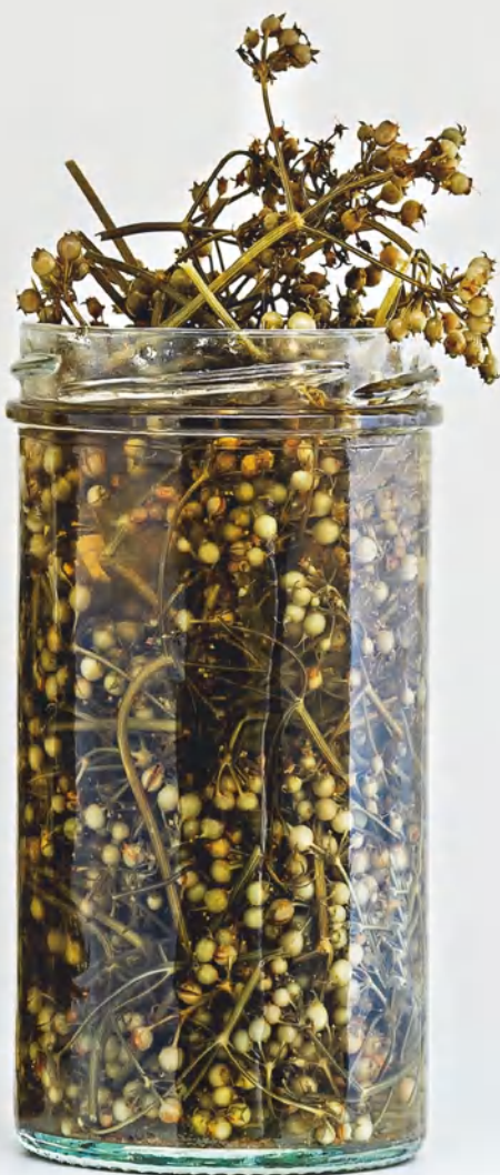
Маринованные семена кори- андра, см. с. 65