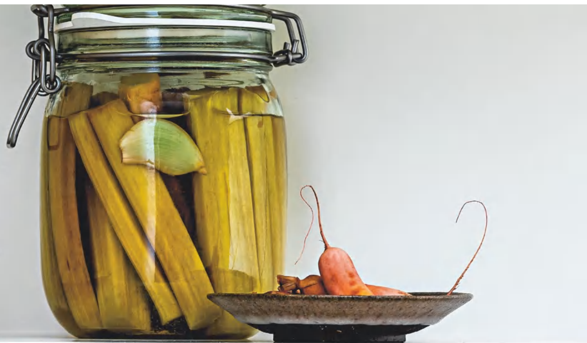
Ферментированный ревень, см. с. 100