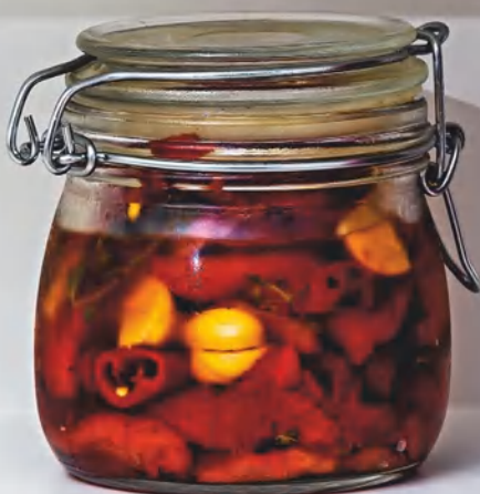
Маринованные сладкие перцы гриль