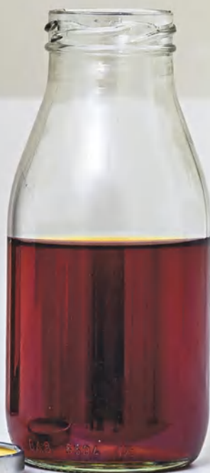
Грибной бульон, см. с. 115