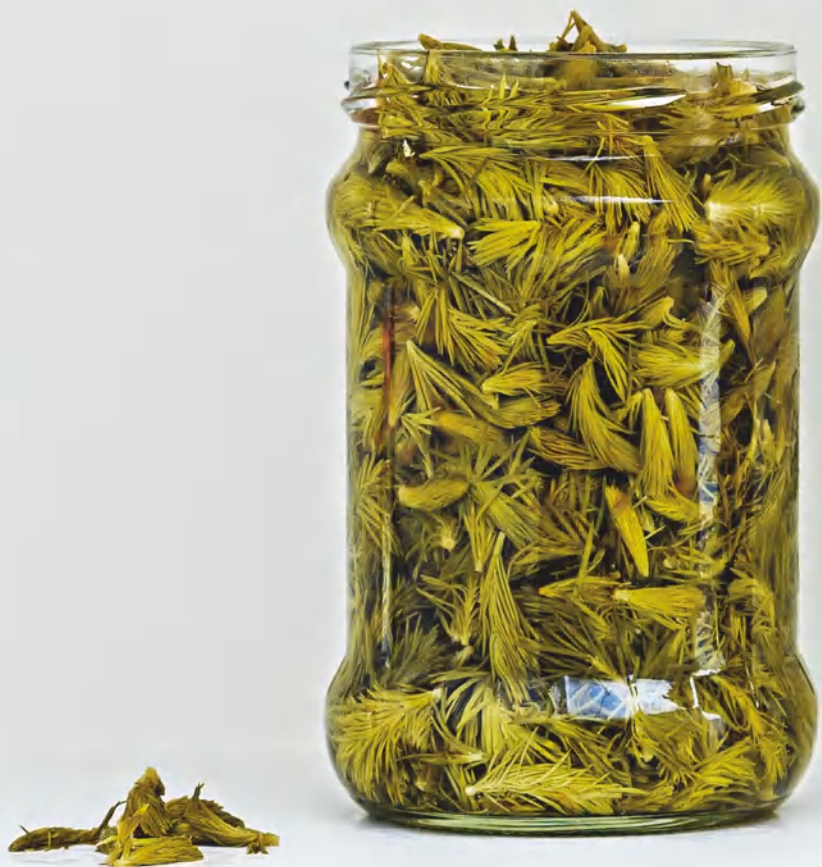
Каперсы из еловых побегов, см. с. 59