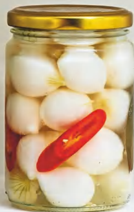
Маринованный лук-севок, см. с. 54