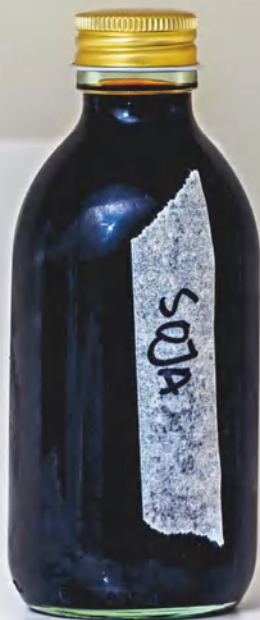
Грибной «соевый» соус