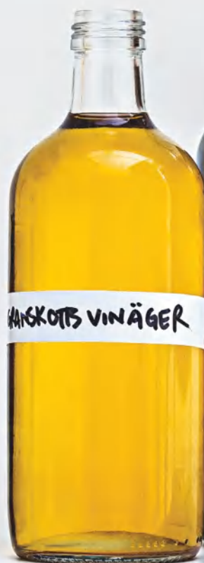
Винный уксус на еловых побегах