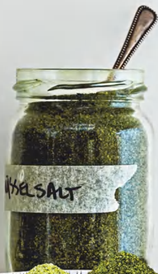
Соль с крапивой