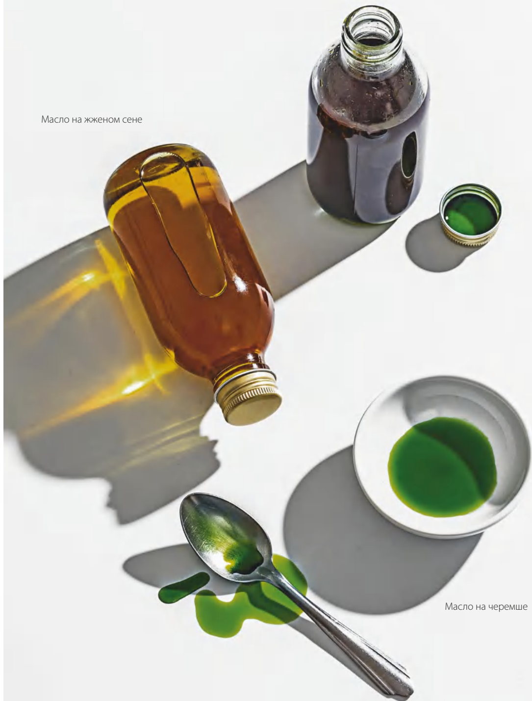
Масло на черемше