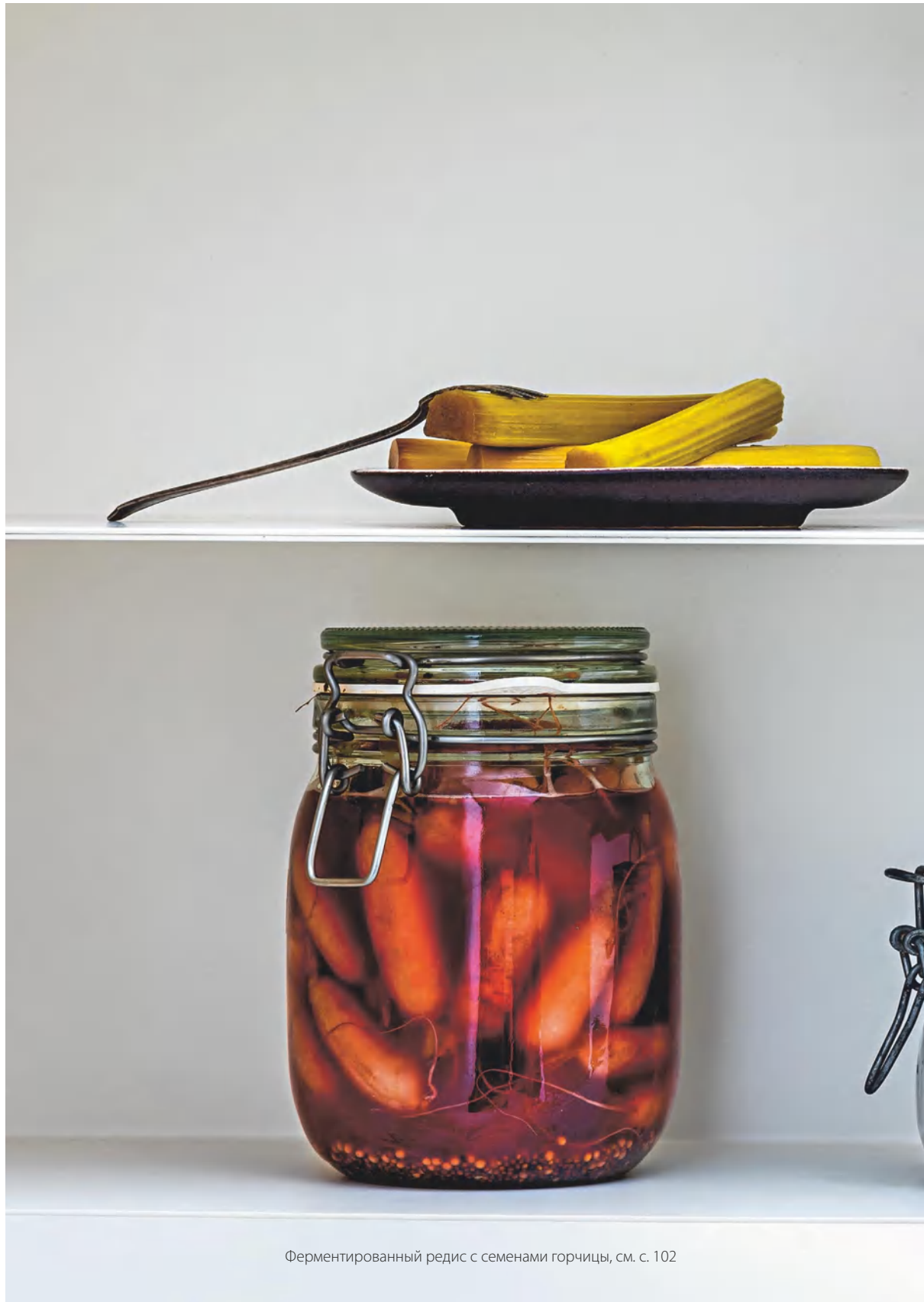
Ферментированный редис с семенами горчицы, см. с. 102