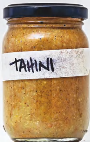
Тахини из семян подсолнечника, см. с. 115