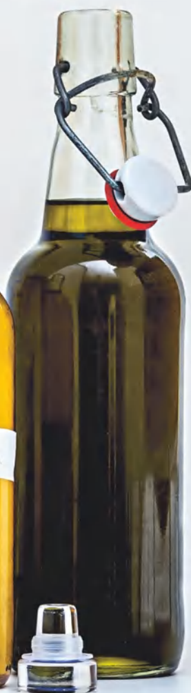
Масло на еловых побегах, см. с. 38