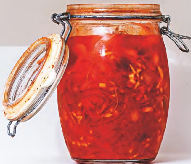
Кимчи из брюквы