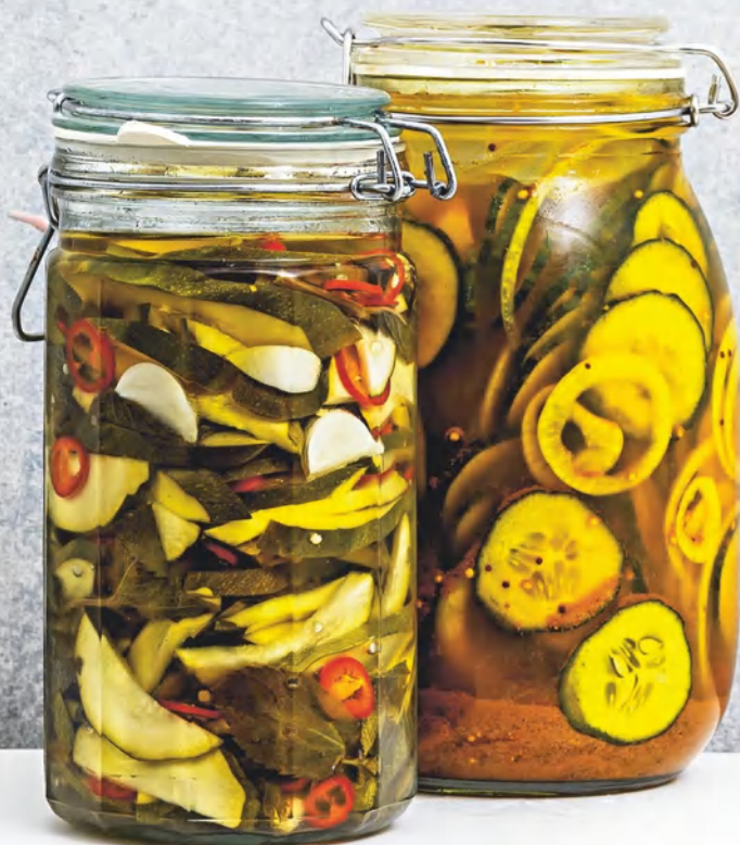
Маринованные цукини, см. с. 58