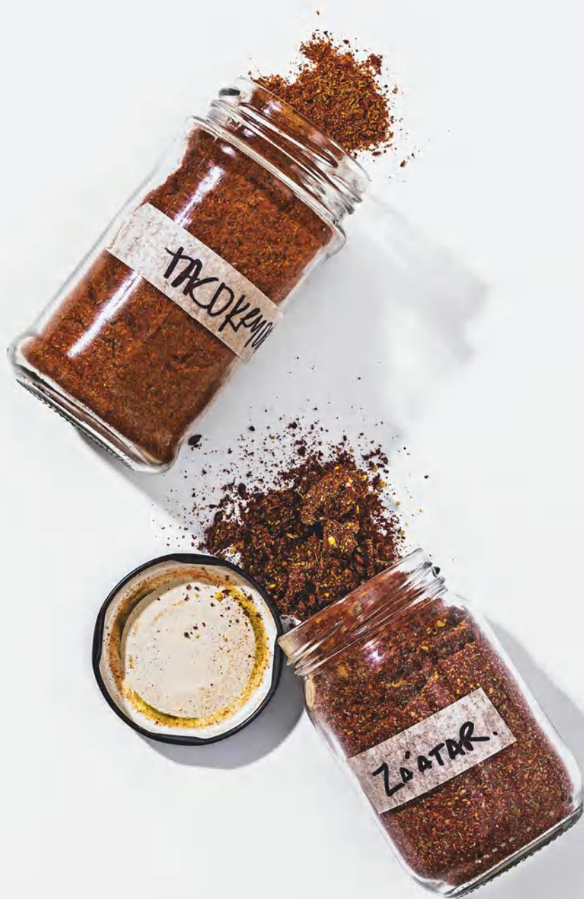
Приправа для тако Заатар