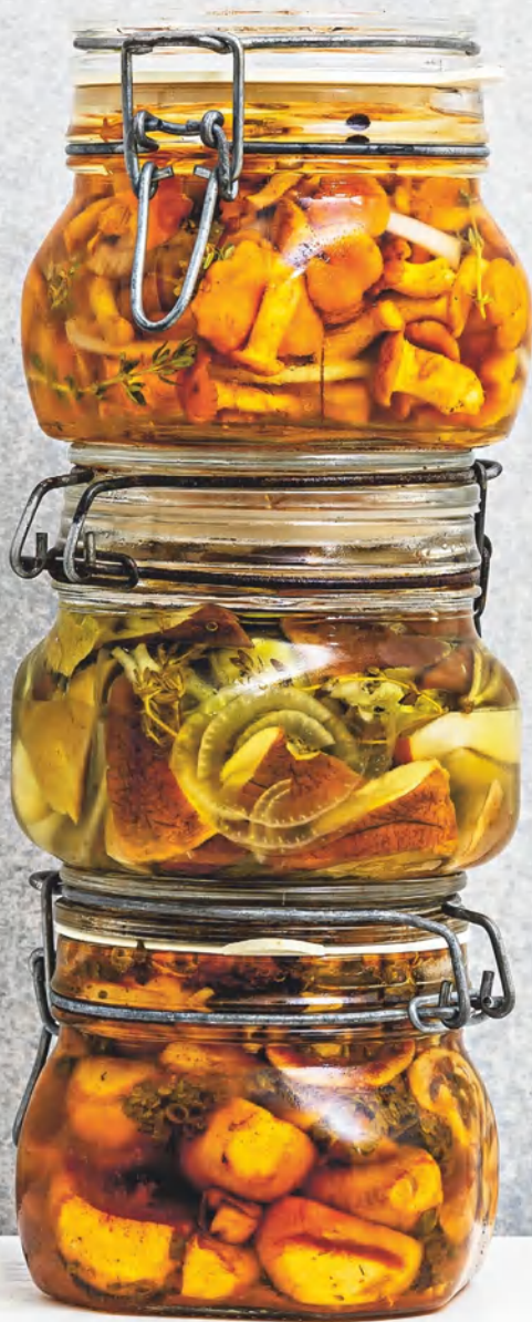
Маринованные лесные грибы, см. с. 75 Маринованные белые грибы Маринованные шампиньоны