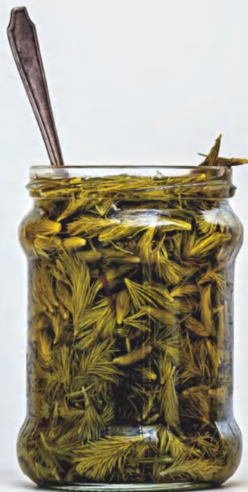
Каперсы из еловых побегов, см. с. 59