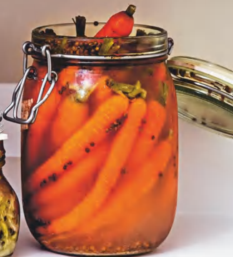
Ферментированная морковь с семенами кориандра, см. с. 96