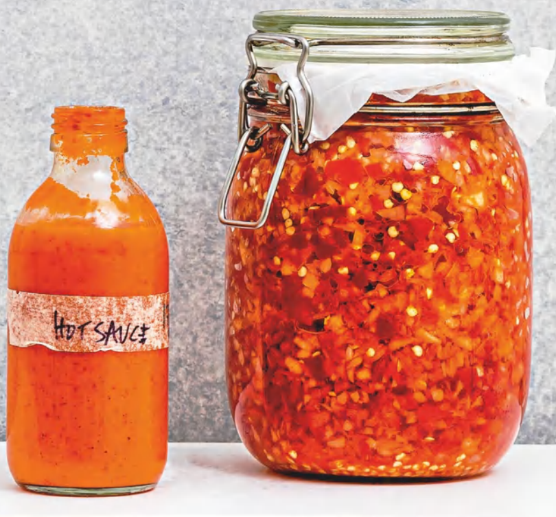
Смешанный в миксере и несмешанный ферментированный соус чили