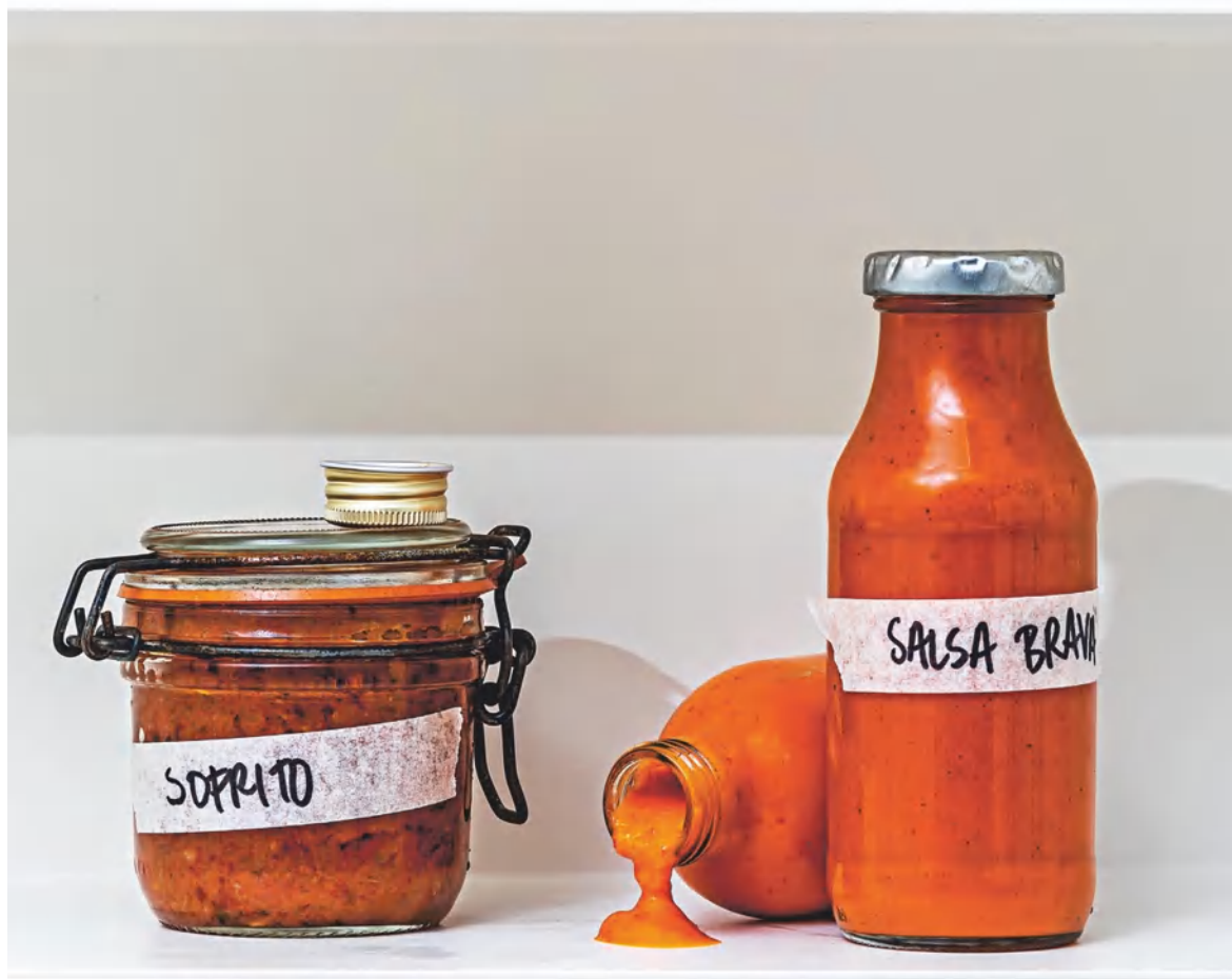
Софрито, см. с. 120