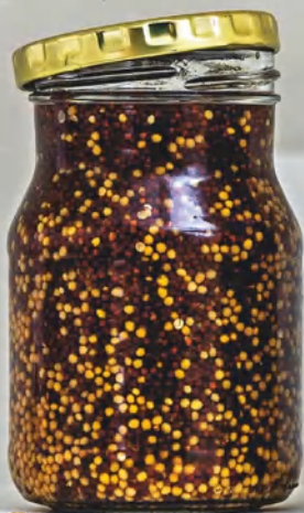
Семена горчицы, см. с. 54