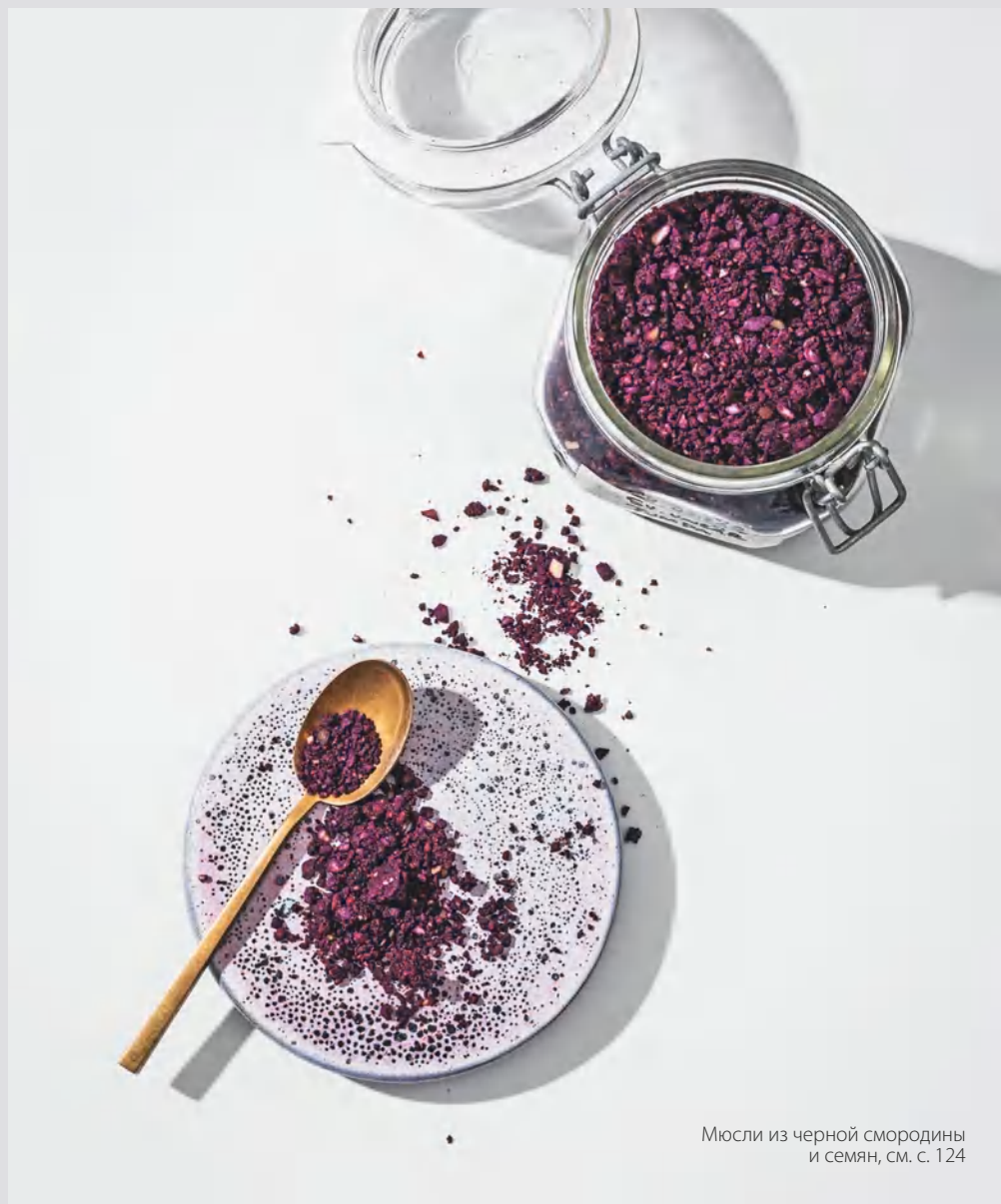
Мюсли из черной смородины и семян, см. с. 124

В этой части собраны разные рецепты заготовок, которые хорошо иметь в холодильнике или в кладовой в долгие зимние месяцы. Здесь найдется все — от грибного «соевого» соуса до пасты тахини, от острого соуса до черники на спирту.