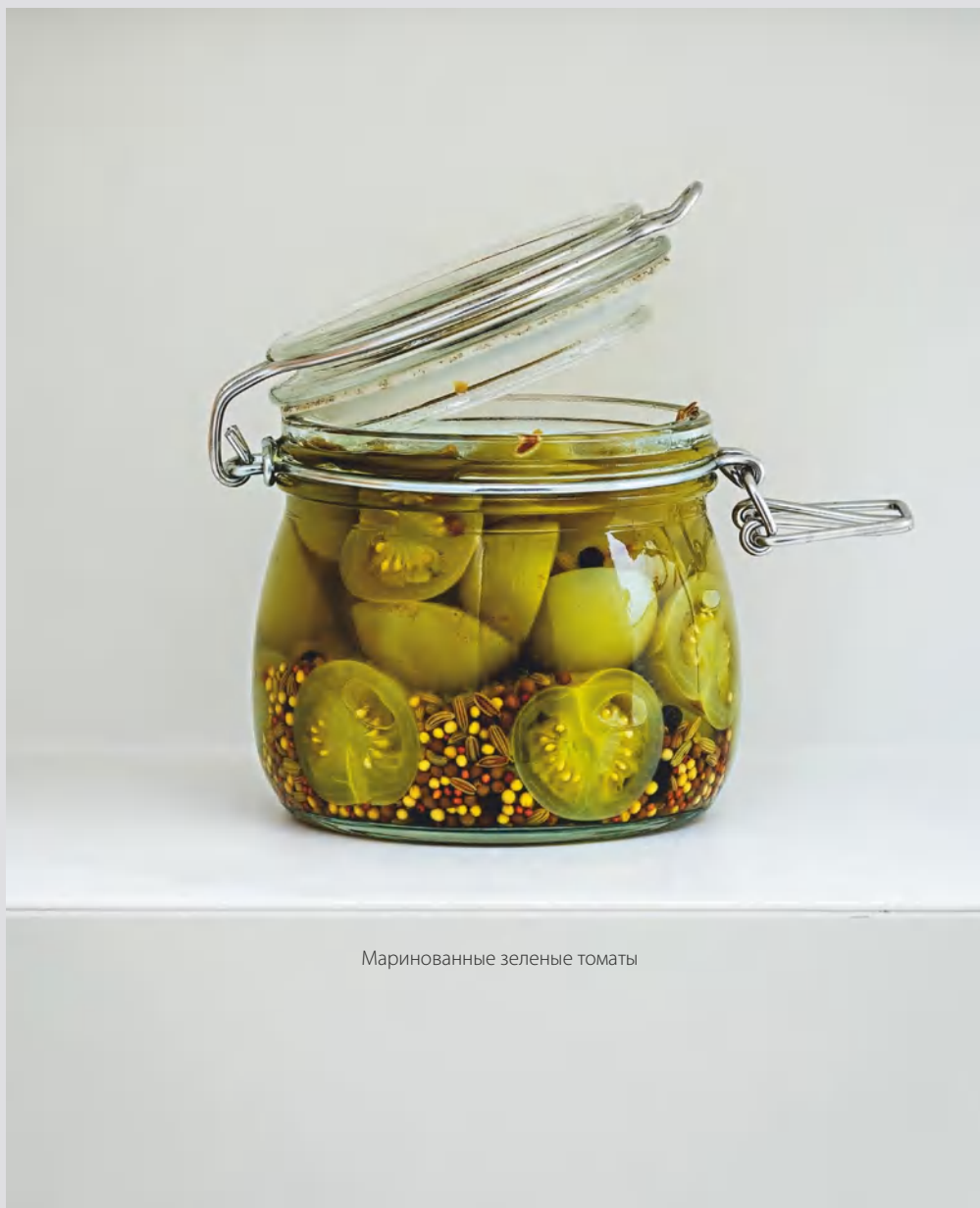
Маринованные зеленые томаты

Здесь я собрал те варианты консервирования, которые не вписываются ни в одну из трех предыдущих категорий, например соленые лимоны, ревень с гибискусом или маринованные белые грибы. Их консервируют в смеси соли, винного уксуса и сахара или в смеси растительного масла и винного уксуса.