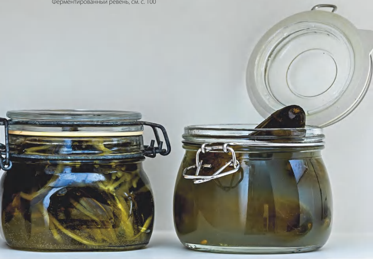
Ферментированные листья черемши, см. с. 101