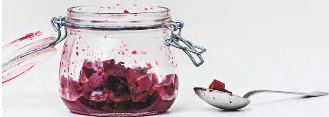
Классическая маринованная свекла