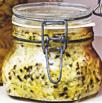
Квашеная белокочанная капуста со шнитт-луком