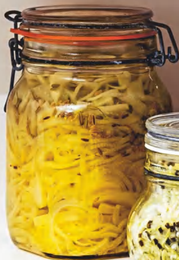
Ферментированный фенхель с семенами, см. с. 97