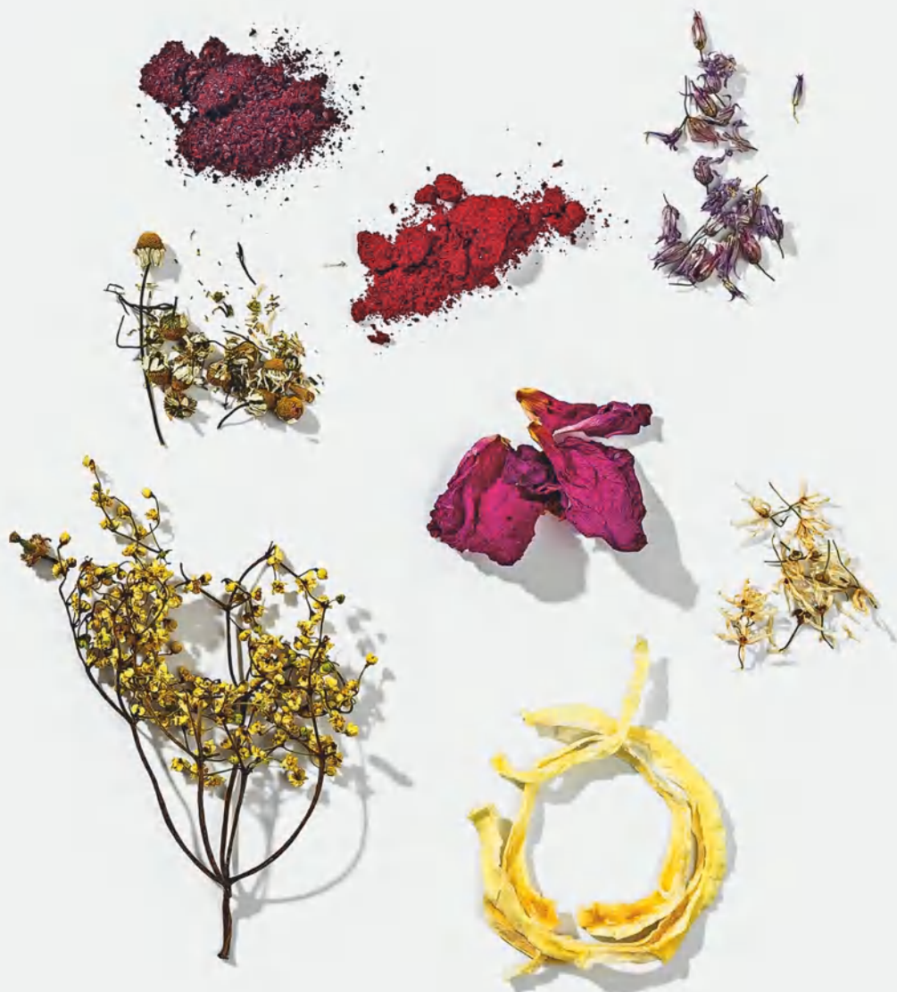
Порошок из черной смородины Ромашка Порошок из брусники Цветки шнитт-лука Шиповник Цветки бузины Цветки черемши Сушеный репчатый лук