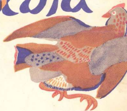
Рис. П. Митурича