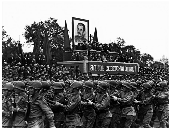
Фото с парада в Харбине в честь Победы над Японией. 16 сентября 1945 г.