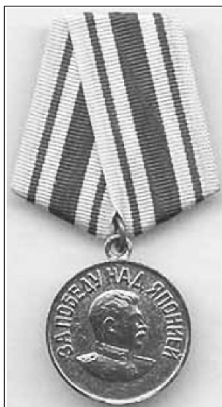
Внешний вид медали «За Победу над Японией»