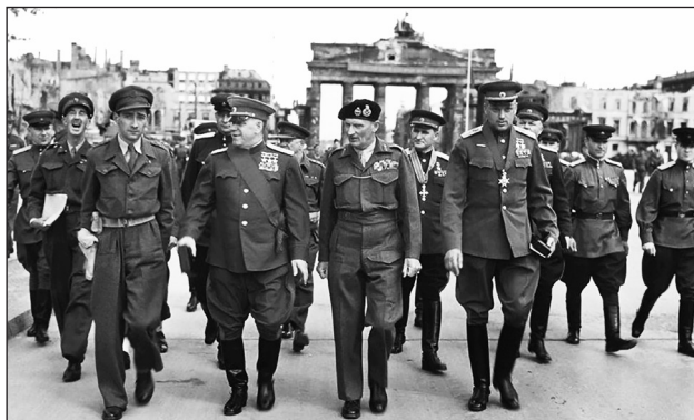
Парад Победы во Второй мировой войне. Берлин, 7 сентября 1945 г. В центре маршал Г. К. Жуков с союзниками.