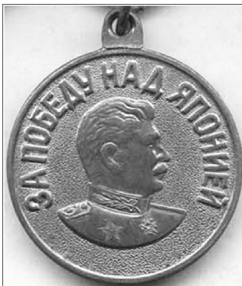
Аверс медали «За Победу над Японией»