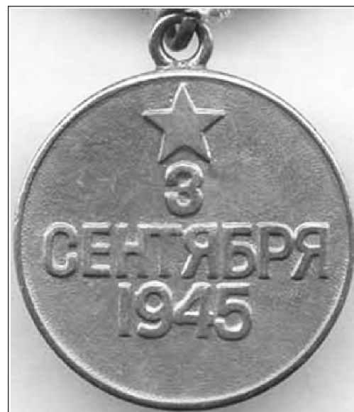
Реверс медали «За Победу над Японией»