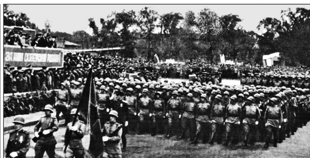
Парад Победы над Японией в освобожденном Харбине 16 сентября 1945 г.