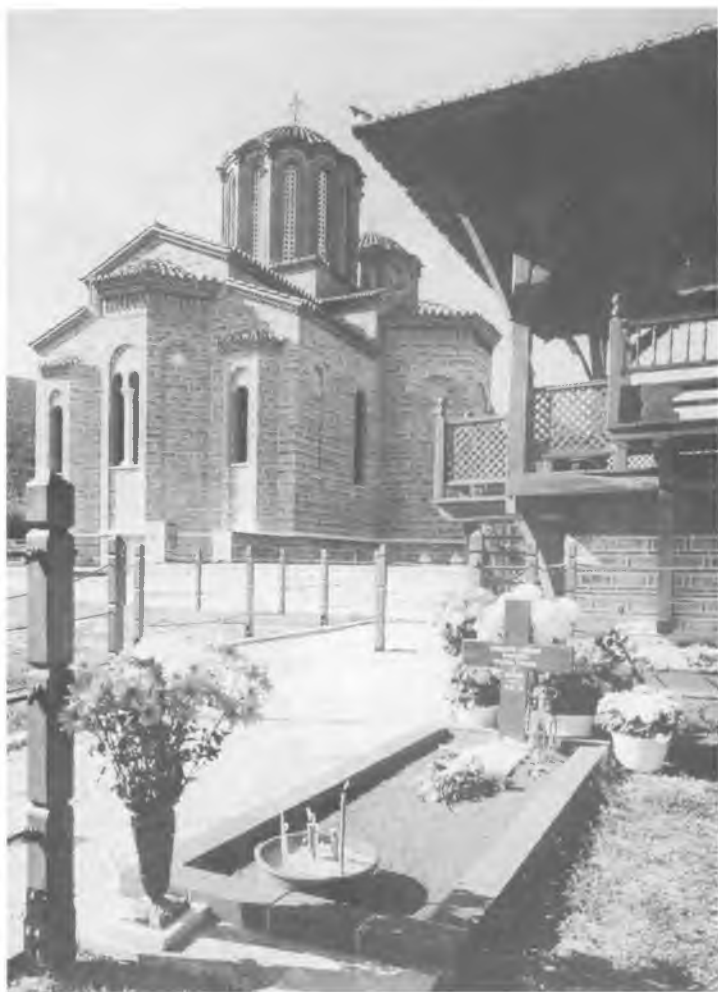
Могила старца Паисия