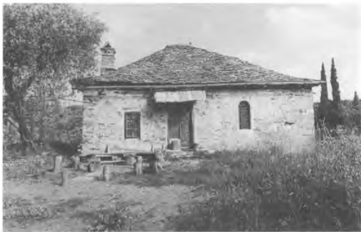
Келлия старца Паисия