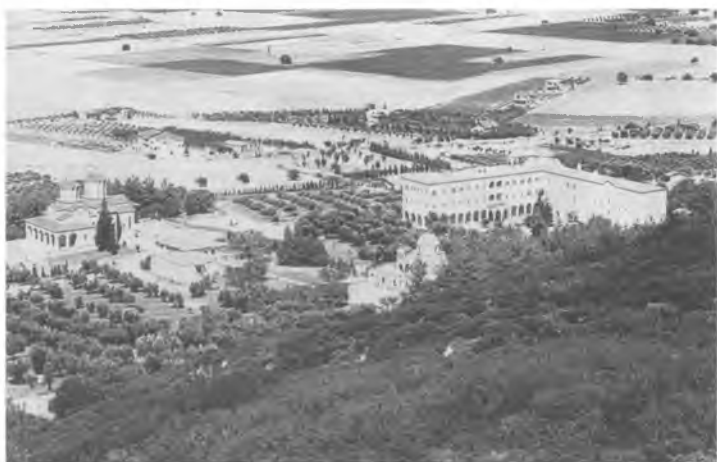
Исихастирий святого апостола Иоанна Богослова в Суроти, где погребен старец Паисий