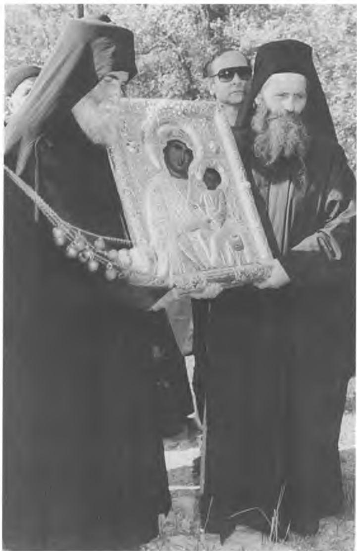
Старец Паисий на крестном ходе с чудотворной иконой Божией Матери