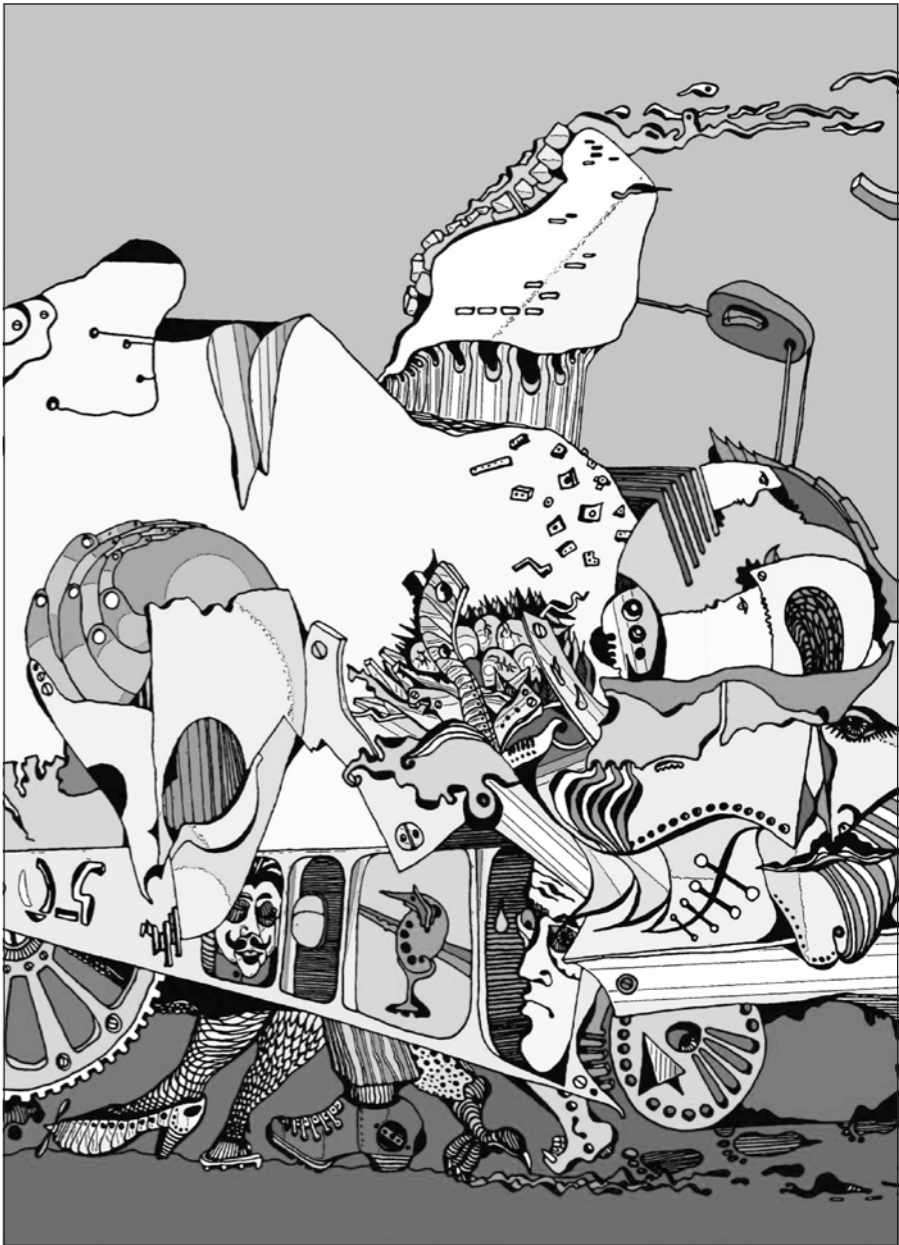
«Чervotochина», художник Василий Проханов

Выступления Сергея ПЕРЕСЛЕГИНА можно посмотреть на интернет-канале «Психотехнология»