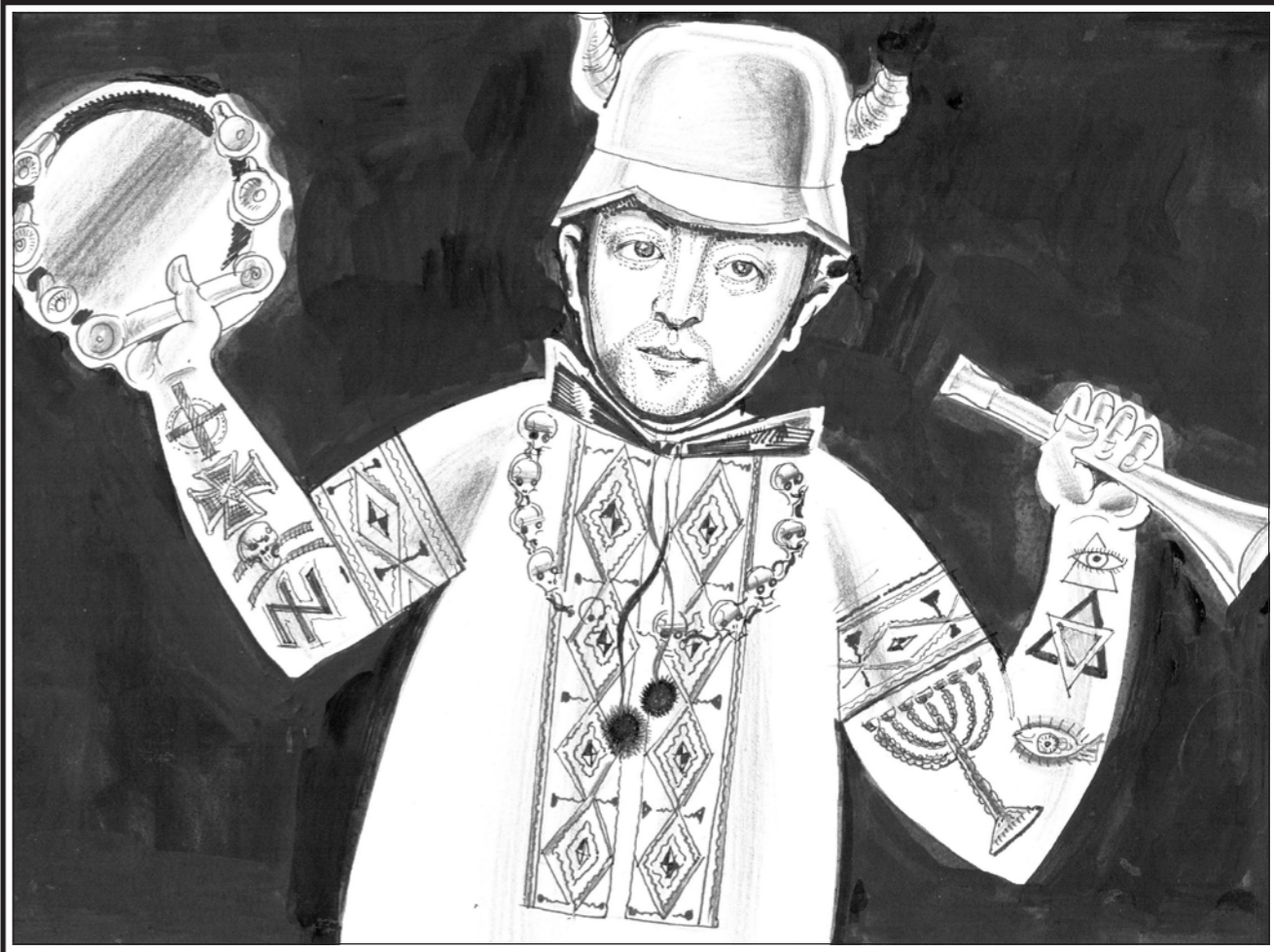
Рис. Геннадия ЖИВОТОВА

Пройдя обряд инициации, оставшись один, Зеленский включает электронную "музыку сфер", в которой грохочут гармоничные водопады и ревущих вулканов, танковых колонн и электронных роботов, музыку, сочинё-