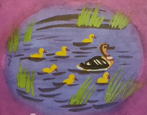
Рисунки В. Дувидова