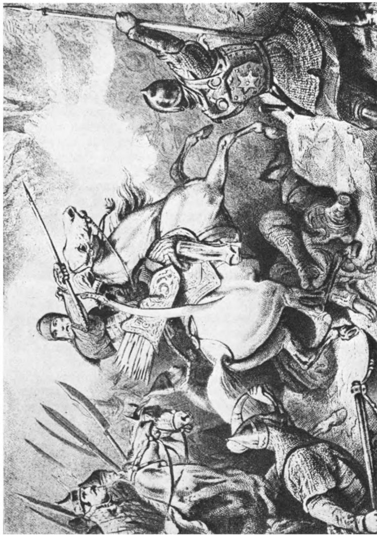
Ермак покоритель Сибири — рисунок А. Шарльмана. Гравюра на стали.