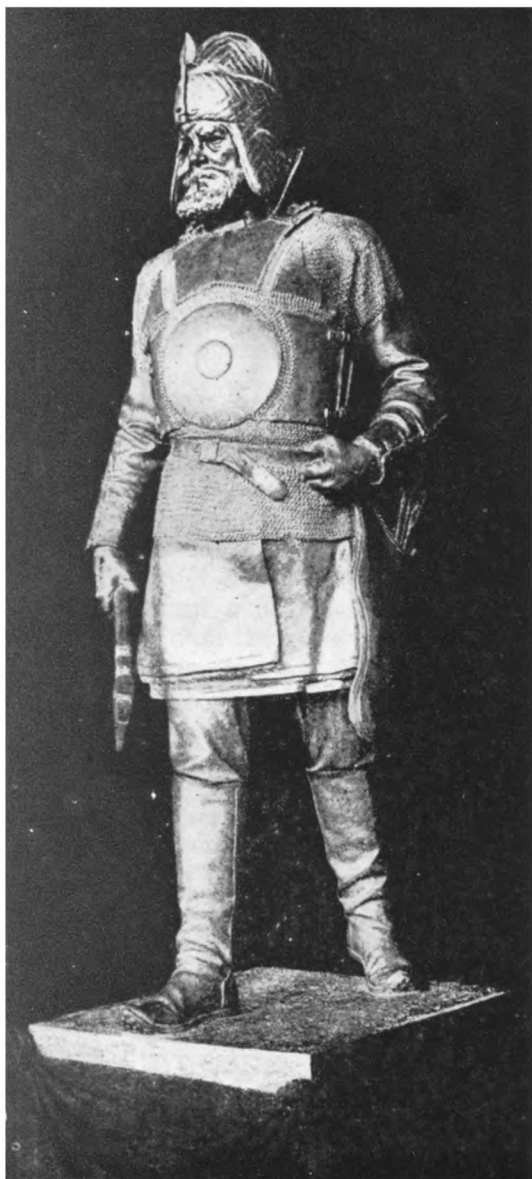
Ермак — статуя М. М. Антокольского.