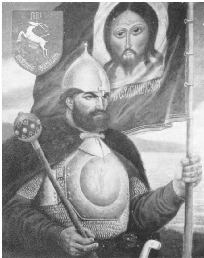
Ермак — картина С. Г. Королькова.