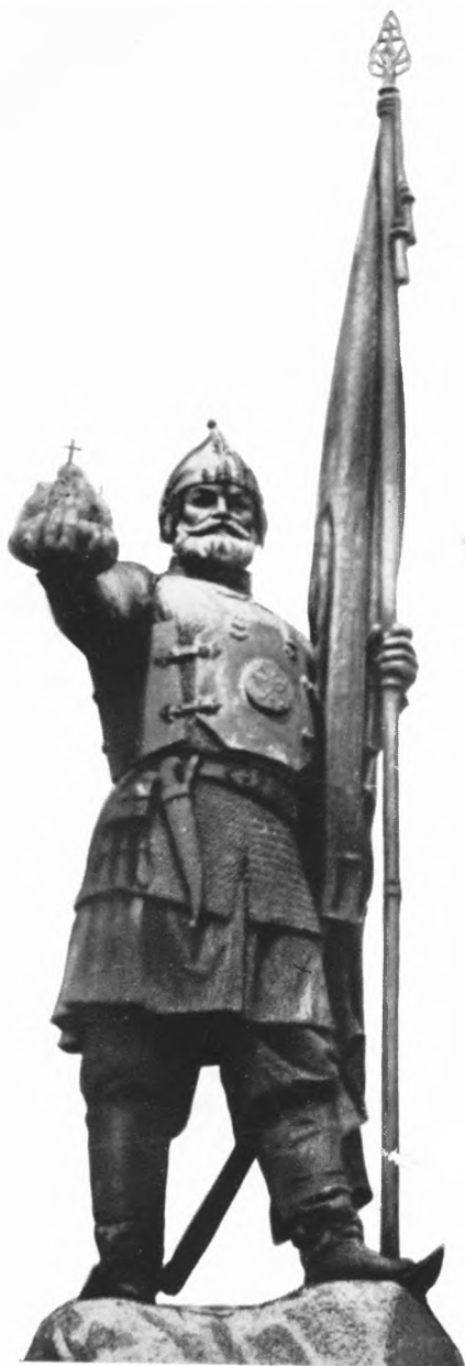
Памятник Ермаку в Новочеркасске.