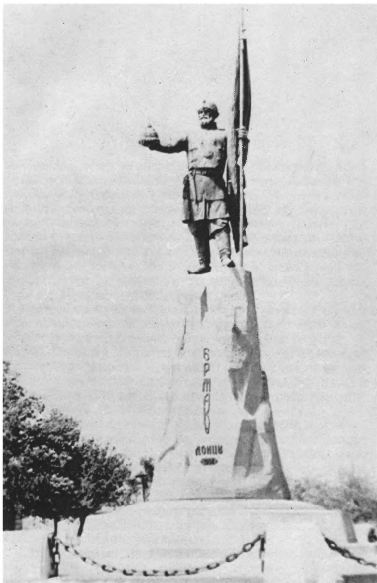
Памятник Ермаку в Новочеркасске.