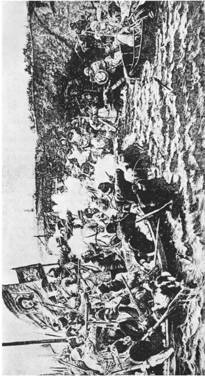
Покорение Сибири — картина В. И. Сурикова.