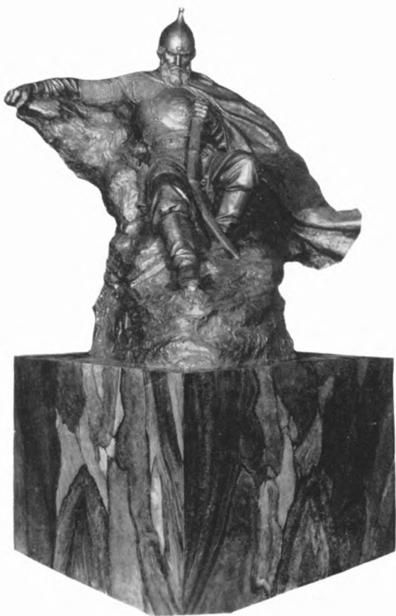
Ермак. — Скульптура С. Г. Королькова.