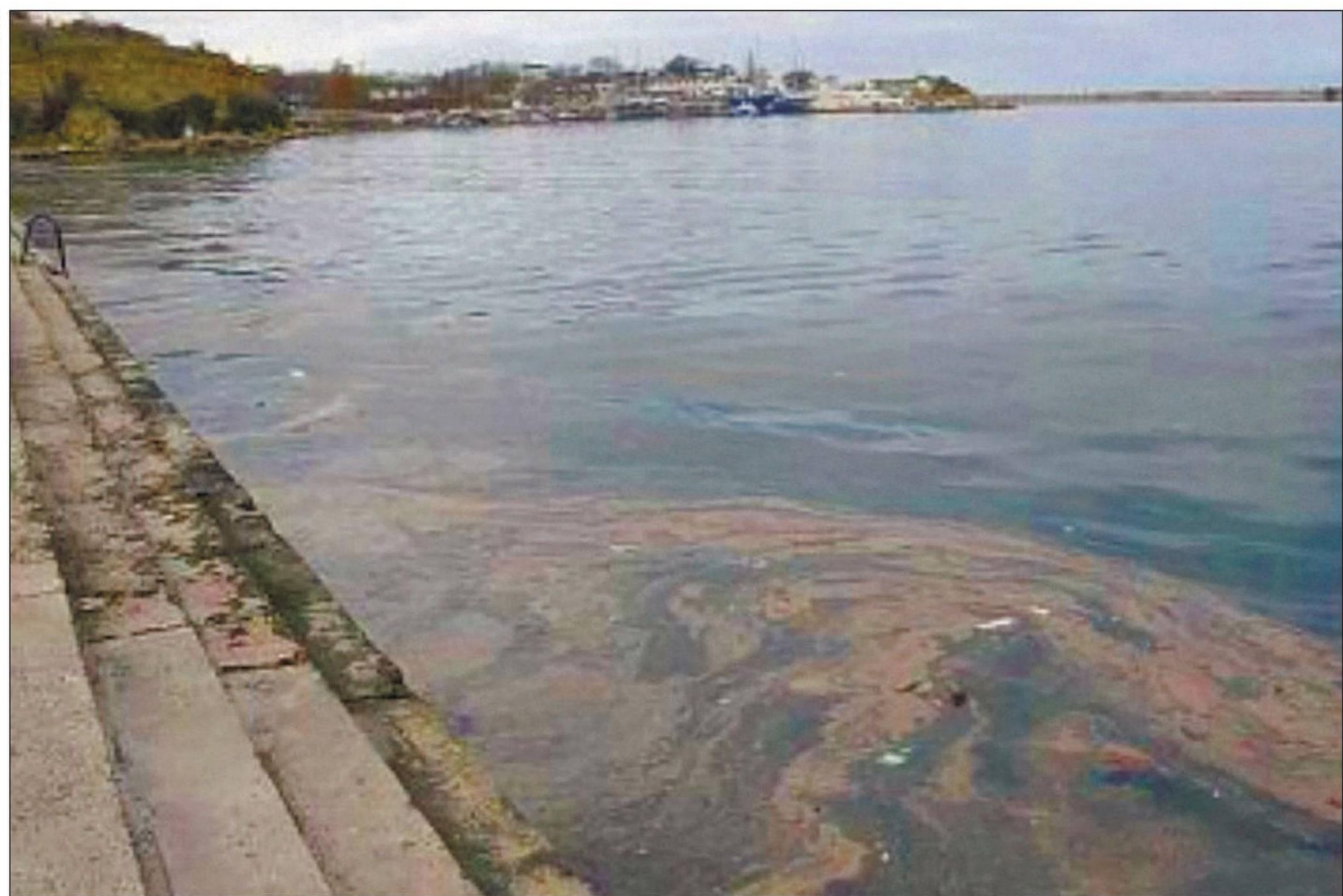
ПЛЯЖ ХРУСТАЛЬНЫЙ, ЦЕНТР СЕВАСТОПОЛЯ

Первоначально к проектированию и застройке региональные