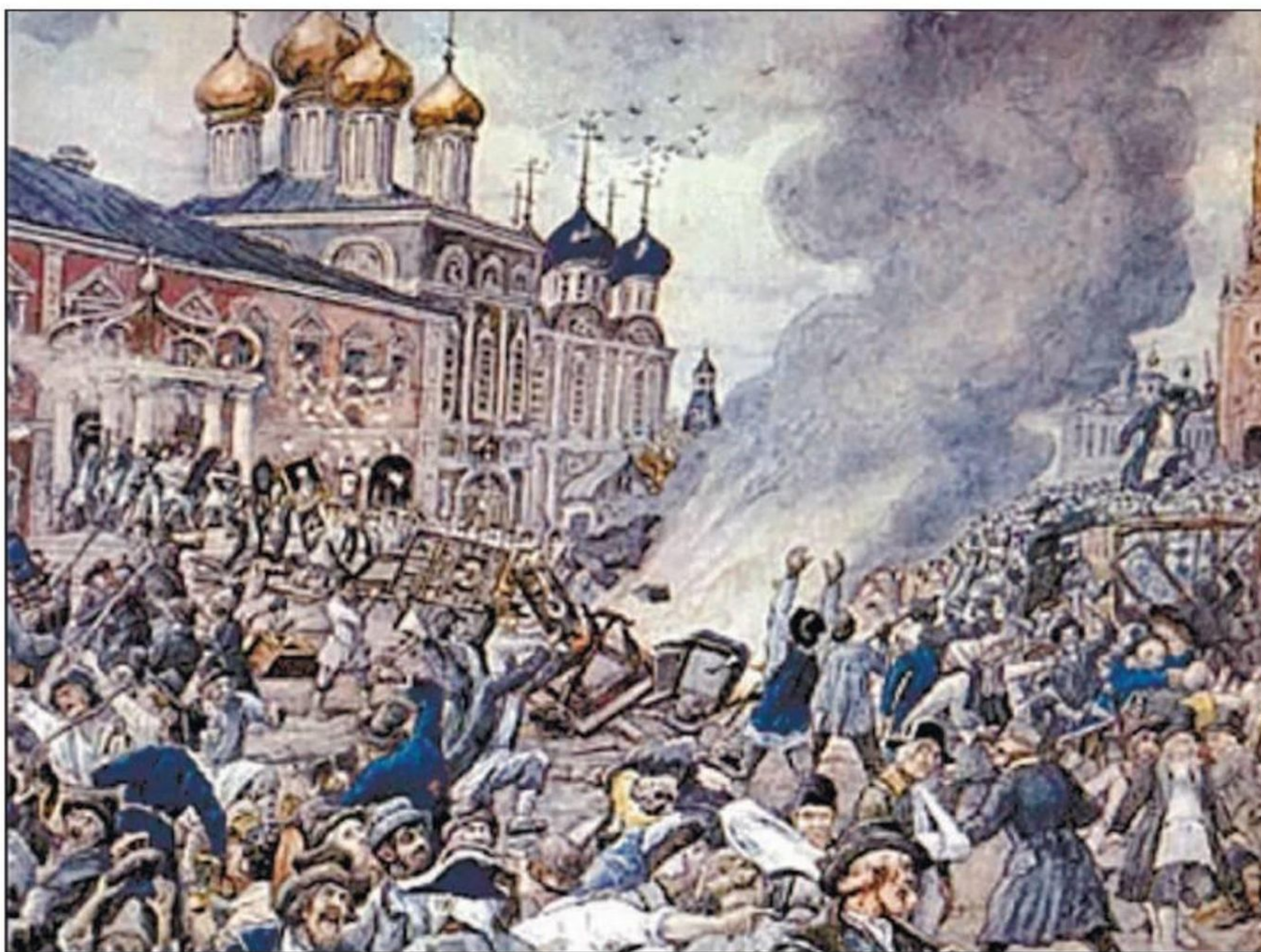
ЧУМНОЙ БУНТ. АКВАДЕЛЬ ЭРНЕСТА ЛИССНЕРА. 1930-Е ГОДЫ

Власти отреагировали проведением в столице противоэпидемиологических мероприятий. Все заболевшие подлежали принудительной изоляции, их вещи немедленно сжигались. По приказу московского генерал-губернатора Петра Салтыкова специально обученные люди окуривали помещения можжевеловым дымом и обрабатывали уксусом деньги и предметы обихода. Считалось, что эти меры дезинфекции могут остановить распространение опасной болезни. Кроме того, власти запретили любые мероприятия с большим скоплением людей и рекомендовали покинуть город всем, у кого была такая возможность. Богатые москвичи так и