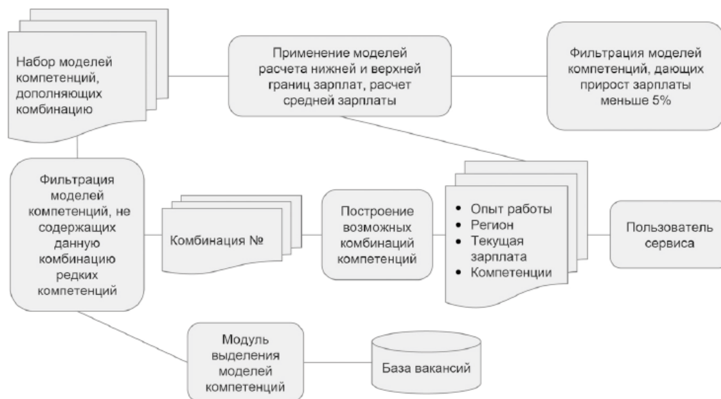
Рис. 8. Архитектура сервиса

Модель рекомендаций обучена на больших данных о спросе на рынке труда и дает ответ на вопрос, какой следующий навык следует развивать, чтобы быть более успешным на рынке труда. Возможность быть успешным на рынке труда определена двумя параметрами — уровнем заработной платы при наличии определенной компетенции (набора компетенций) и запросом на эту компетенцию (набор компетенций) на рынке труда.