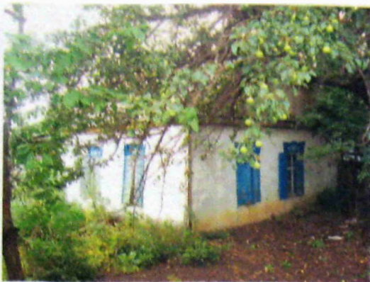
Фото 14. Хата Мирона и Евдокии Ревиных (до 1949 г.) в Архиповке. 2010 год.