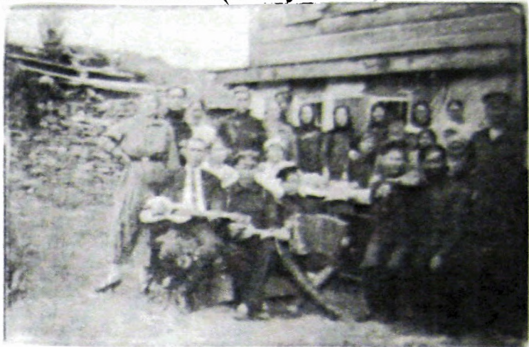
Фото 1. Семья Поповых (х. Забуддыгин) в конце 1920-х годов

Интересны воспоминания очевидцев и участников коллективизации и раскулачивания. Так, во время «раскулачивания» казаки хуторов Забуддыгина и Груцынова, выгнанные из домов до отправки в райцентр проживали в вырытых наспех землянках в балке между хуторами Груцынов и Плешаков. До сих пор эту балку в народе называют «кулацкой». Их дома и хозяйственные постройки подлежали уничтожению. Например, камень колхозная строительная бригада использовала при ремонте дорог.