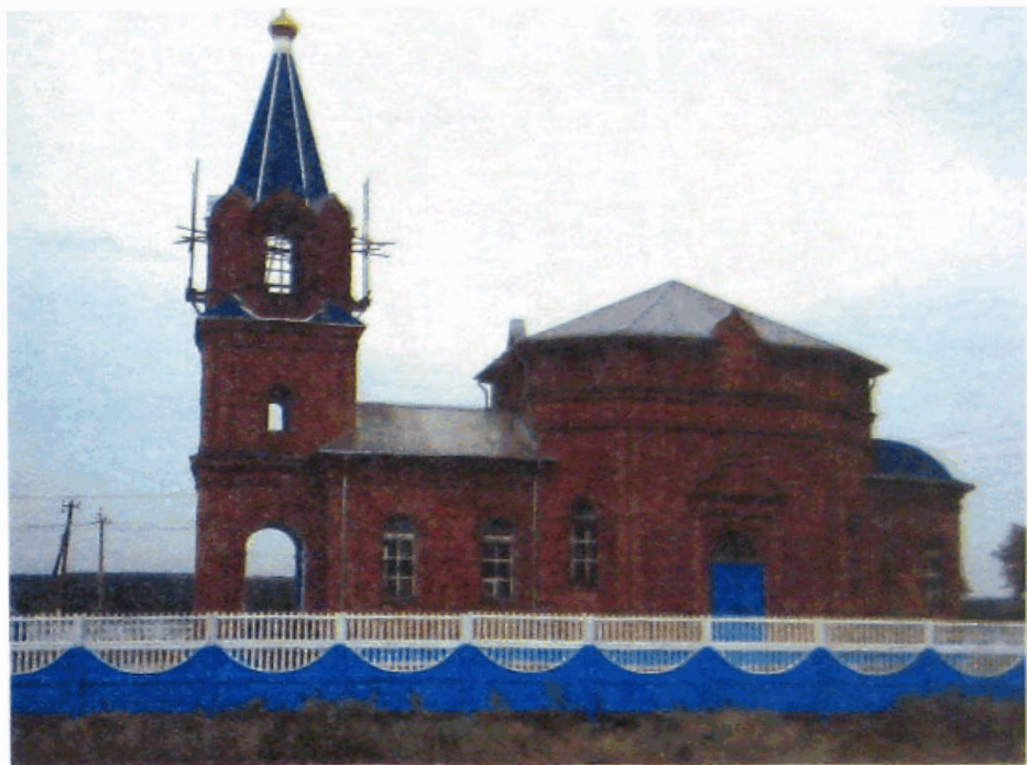
Фото 12. Богородицкая церковь слободы Шарпаевка. 2010 год.