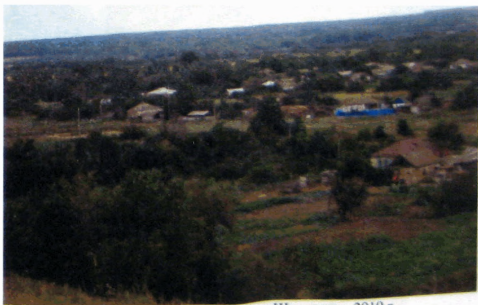
Фото 13. Вид на слободу Шарпаевка. 2010 г.