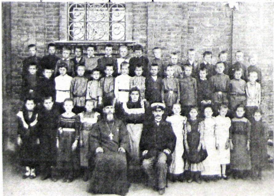
Фото 2. Сулиновская церковно-приходская школа. 1901 год.

Мать - уроженка города Шахт, дочь мелкого торговца, грамотная, модистка в молодости, затем домашняя хозяйка. Умерла в 1938 г. В семье отца было десять детей. Я родился в 1890 г. и был вторым ребёнком. В 1899 г. пошёл в школу.