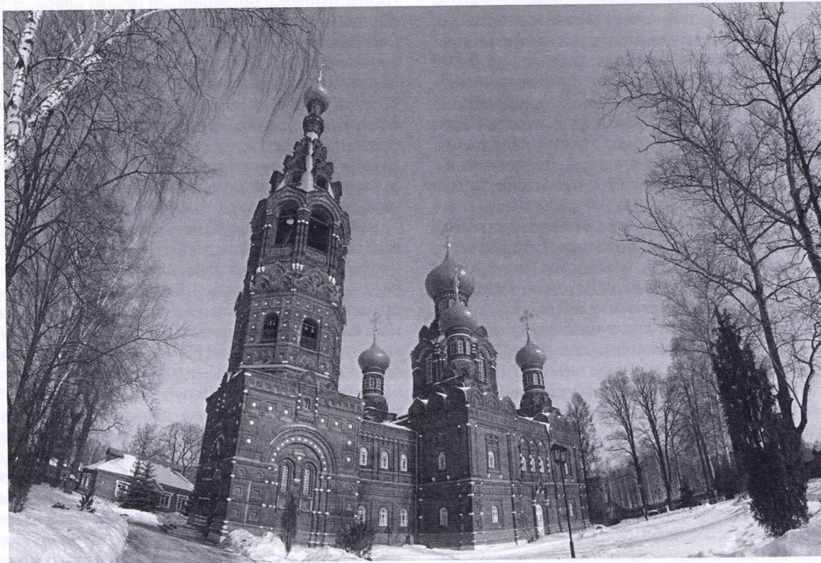
Рис. 4. Храм Покрова Пресвятой Богородицы после восстановления

Ольга Фирсова единственная проработала всю