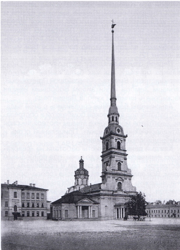
Рис. 1. Петропавловский собор

до люка, от которого он спустился. Обвитая вокруг шпиля веревка могла уже плотно прижимать его к шпилю, а вместе с тем стягиванием свободного конца веревки через петлю он получил возможность укорачивать веревочное кольцо на шпилье, что было необходимо по мере подъема к более узкой его части. Таким образом, поддержка корпуса была обеспечена. Но нужны были еще средства для подъема. От верхнего люка до самого яблока, на котором находится крест с ангелом, расположены по длине шпиля железные крюки, один от другого в 3,2 м, с выступом от крыши на 9 см. Ими Телушкин и воспользовался для дальнейшего восхождения. Из двух веревок с помощью петель он устроил подвижные стремена, которые и накинул на ближайший крюк. С помощью этих петель Телушкин от крюка к крюку добрался до самого яблока.