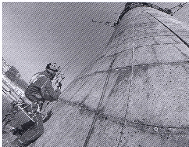
Рис. 5. Изучение состояние бетона на наружной поверхности Останкинской телевизионной башни

Для измерений по высоте 0,0...361 м принято 8 уровней, на которых на башне имеются кольцевые балконы. Кроме того, выполнены замеры на отметке 67 м и в районе перегиба ствола в районе отметки 63 м, где нет кольцевых балконов, эти измерения выполнялись методом промышленного альпинизма (рис. 5). Особенность этого обследования состояла в том, что для начала измерений на приборе необходимо создать усилие около 20 кг. Выпол-