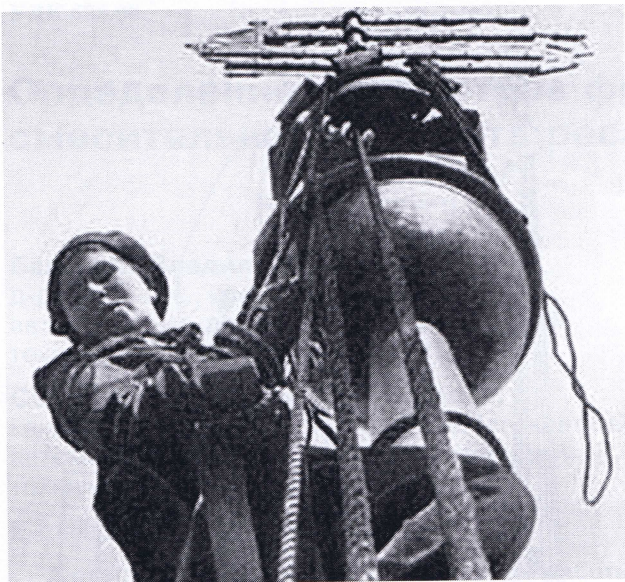
Рис. 3. Снятие чехла со шпиля Адмиралтейства 30.04.1945