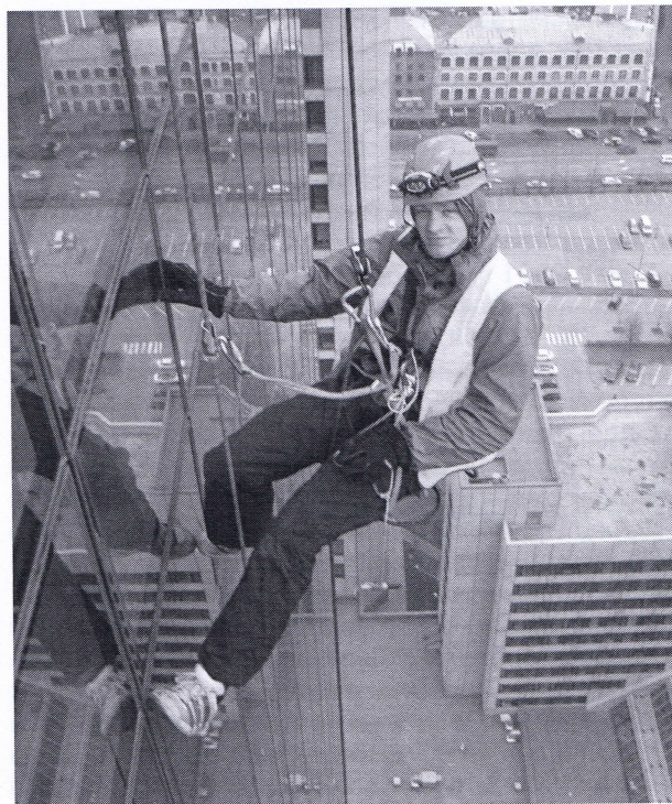
Рис. 7. Подвеска промышленного альпиниста