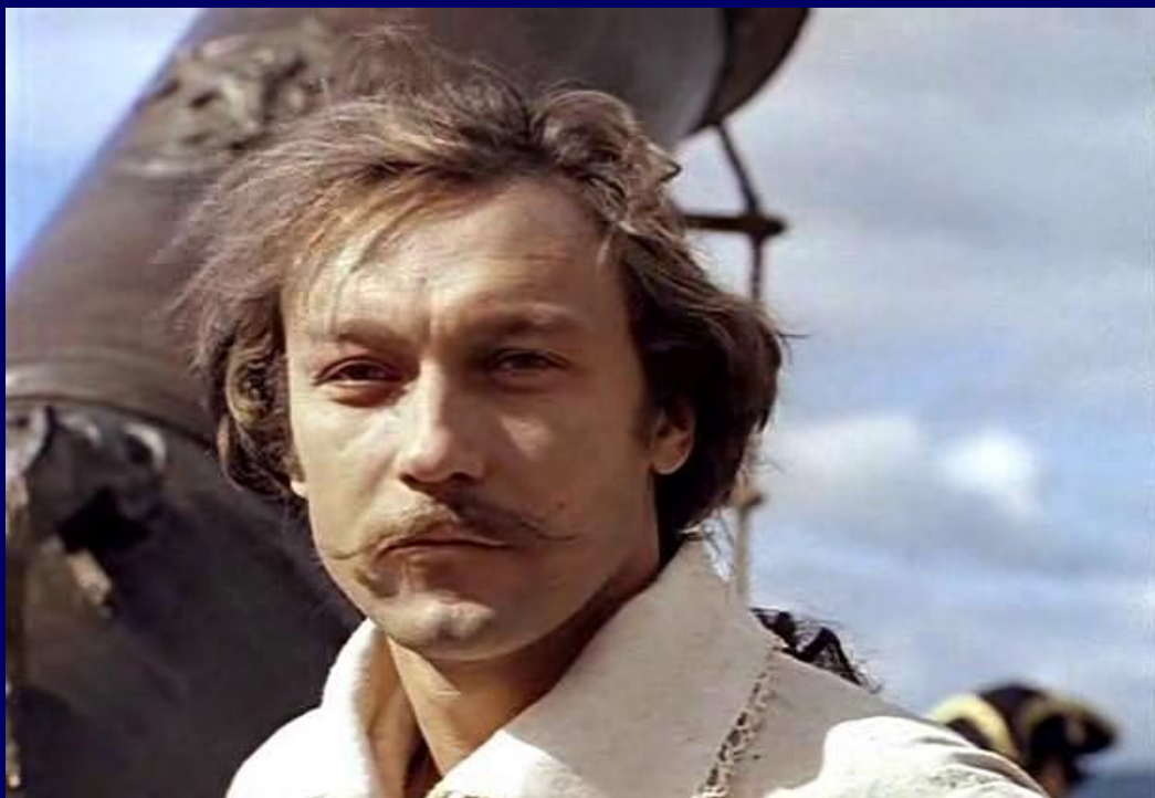
Олег Янковский в роли барона Мюнхгаузена в фильме Марка Захарова «Тот самый Мюнхгаузен»

Мня Миф вымыслом праздным, себя зрим ничем: Миф – есть мы.